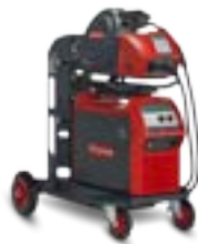
TransSteel 4000 Pulse