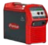
TransSteel 5000 Pulse